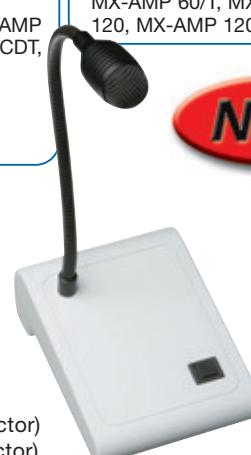
M-D 01X (with XLR Connector) M-D 01D (with DIN Connector)